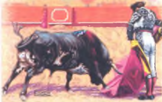
Dispo. Legal CA-115/2000. Prohibida la reproducción.