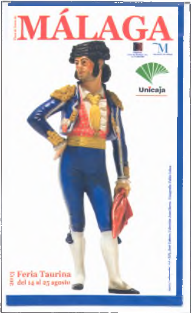
PLAZA DE TOROS DE MALAGA VIII Certamen Internacional de Escuelas Taurinas Feria Taurina del 14 al 25 de Agosto de 2013