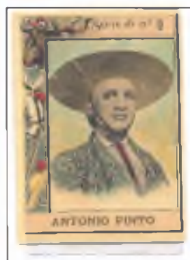
Nacido en Utrera en 1826. Acompañó a Francisco Montes en su reaparición en 1850, volviendo a torear con Cuchares y el Chiclanero .