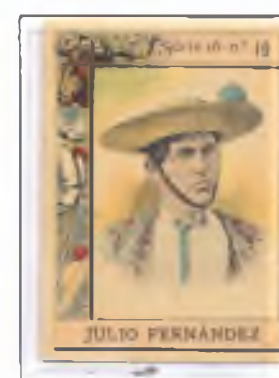
Sevillano que se estrenó en Madrid el 18 de mayo de 1871, fue un buen piquero y conocedor de todas las reglas.