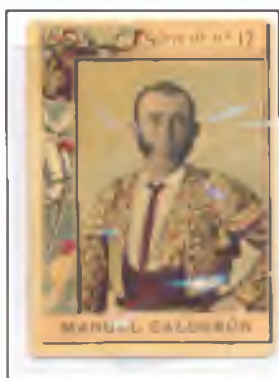
Nacido el 2 de octubre de 1840, el menor de los hermanos de Alcalá de Guadaíra y fue el menos brillante de la familia.