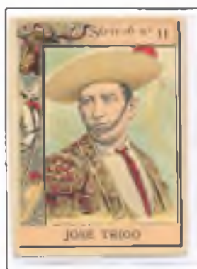
Nacido en Sevilla en 1814, su fama fue tan brillante que se le atribuye el haber detenido una corrida con el regeton de la vara.