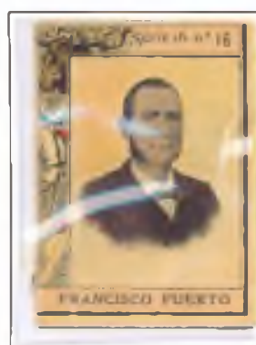
Nacido en el Puerto de Santa María el 3 de febrero de 1819, en 1856 se retiró y se casó con la viuda de Paquiro .