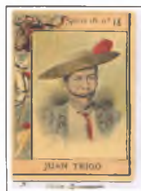
Nacido en Madrid el 7 de julio de 1844, se inició como torero con fatal fortuna, cambiando a picador donde destacó notablemente.