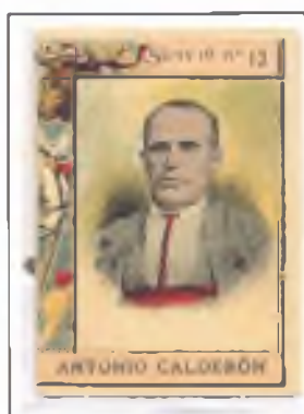
Nacido en Alcalá de Guadaíra en 1821, estuvo en activo durante 27 años siempre a las órdenes de los mejores espadas de la época.