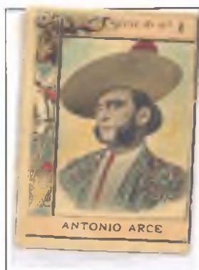
Nacido en Madrid, era muy corpulento, muy valiente y conocedor de todas las suertes.