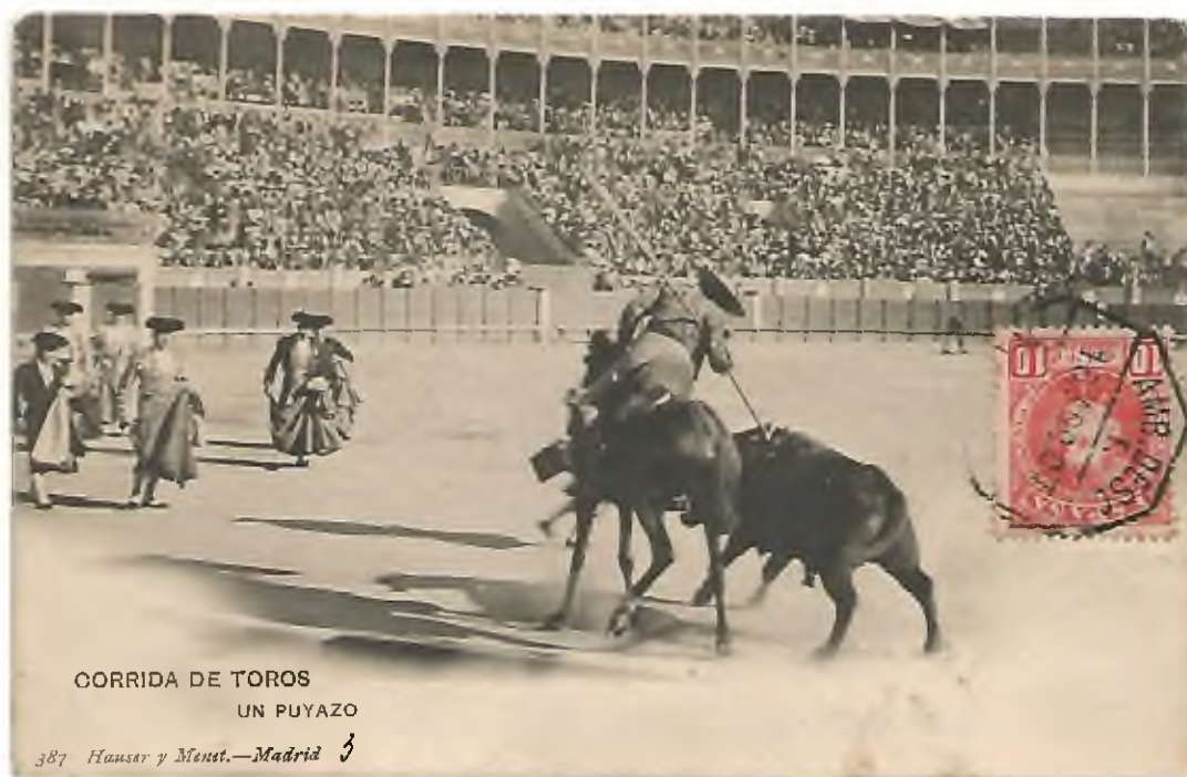
CORRIDA DE TOROS UN PUYAZO

P: Edición Hauser y Menet, nº 387 de la serie Corrida de Toros. Madrid. Fototípia. Circulada el 16 de agosto de 1907.