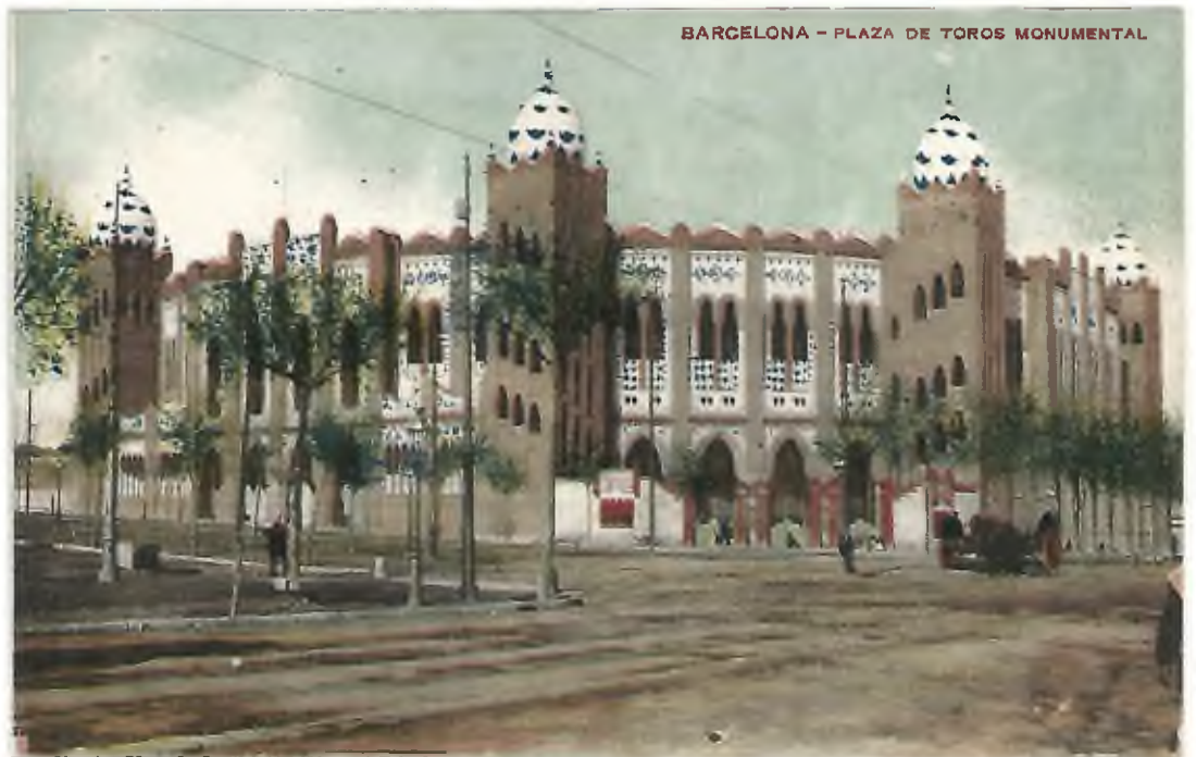
BARCELONA - PLAZA DE TOROS MONUMENTAL

P: Edición Missé Hts, sin número. Barcelona. Fotocromía. No circulada.