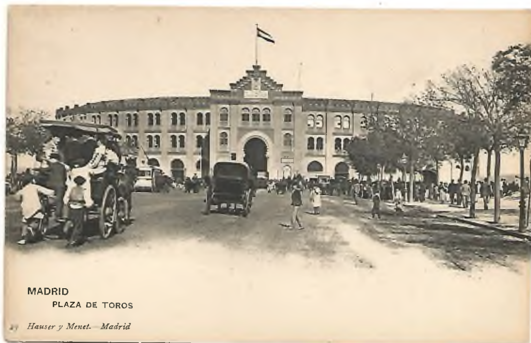
MADRID PLAZA DE TOROS