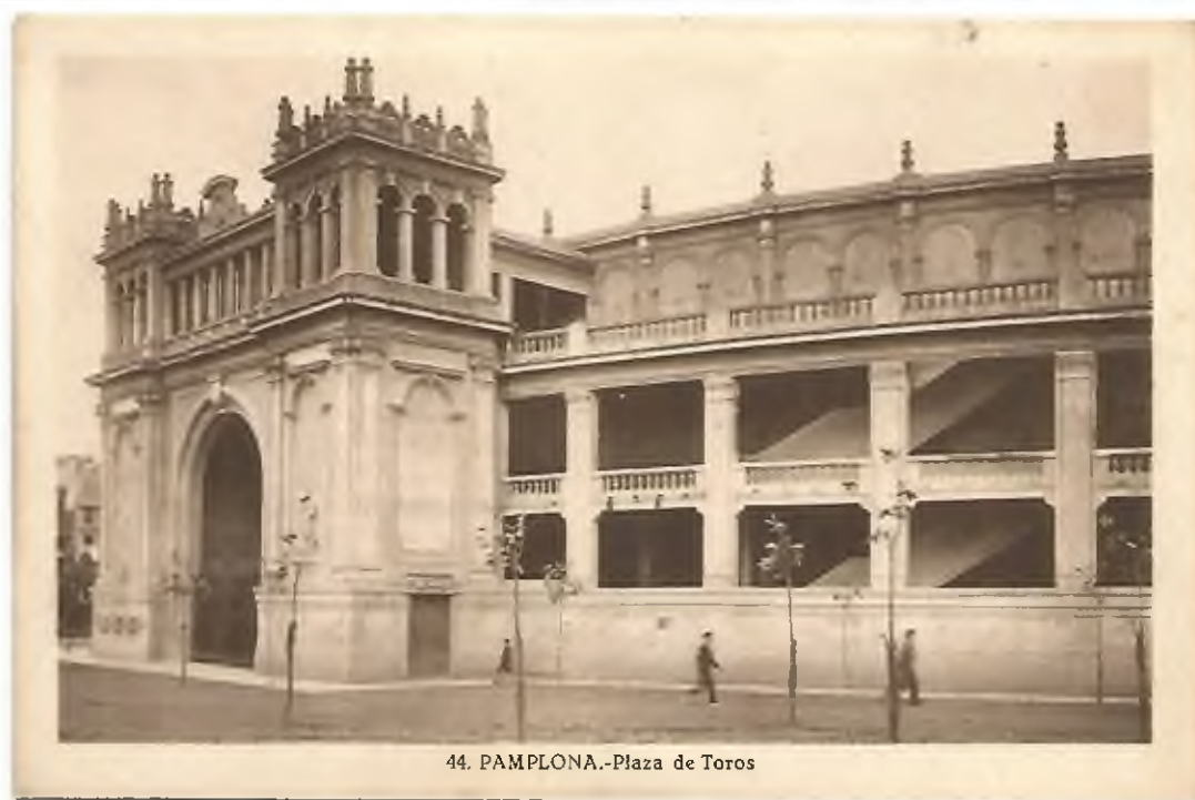
44. PAMPLONA.-Plaza de Toros

La plaza de toros Monumental de Pamplona es propiedad de la Casa de Misericordia de Pamplona. Se inauguró para los Sanfermines el 7 de julio de 1922.