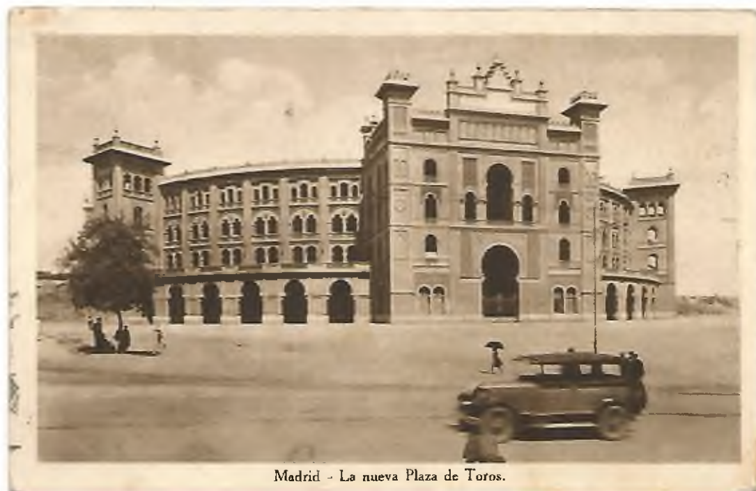
Madrid - La nueva Plaza de Toros.

P: Edición desconocida , sin número. Fototipia . Circulada.