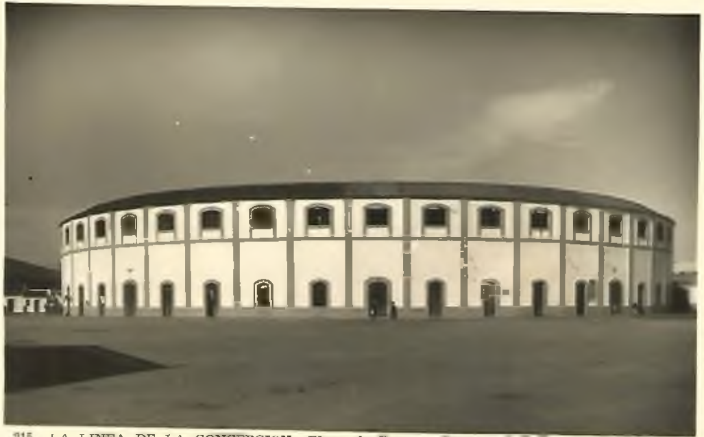
215. LA LINEA DE LA CONCEPCION. Plaza de Toros - Square of Bull

La plaza de toros de La Línea de la Concepción por culpa de la decidía municipal perdió la parte alta en la década de los setenta y ochenta del siglo XX.