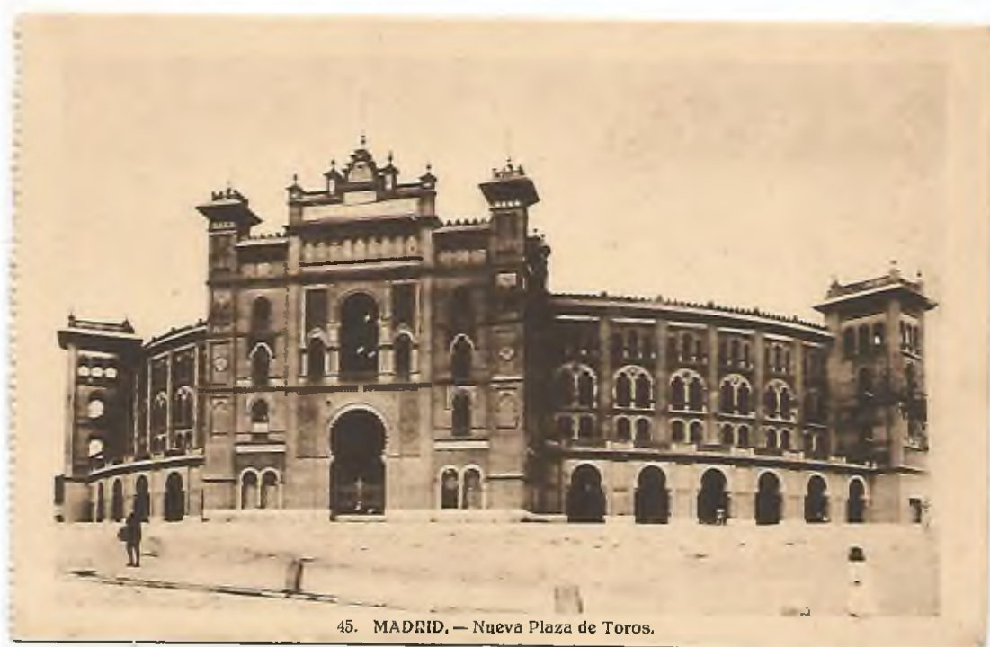
45. MADRID. — Nueva Plaza de Toros.

La Monumental de Las Ventas de Madrid es el mayor coso taurino de España. Inaugurada el 17 de junio de 1931 con una corrida a beneficio del paro obrero.