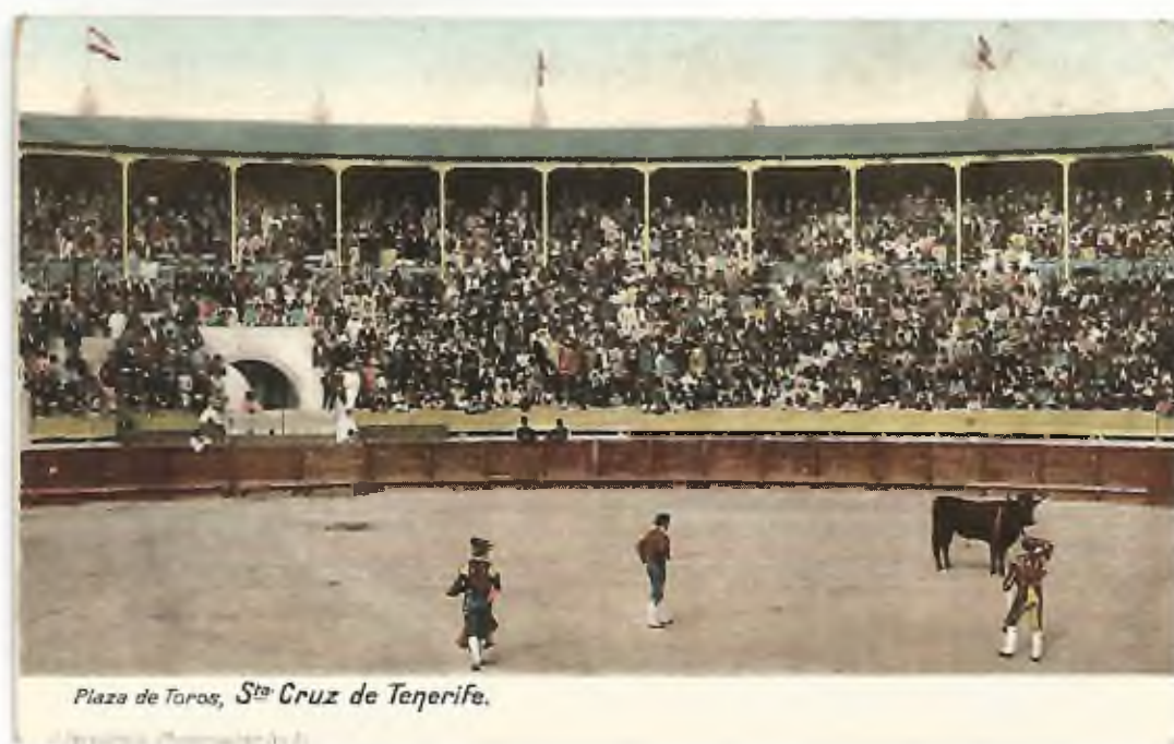
Plaza de Toros, St a Cruz de Tenerife.

P: Edición J Perestrello, nº 51. Fotocromía. No circulada. Edición de 1900.