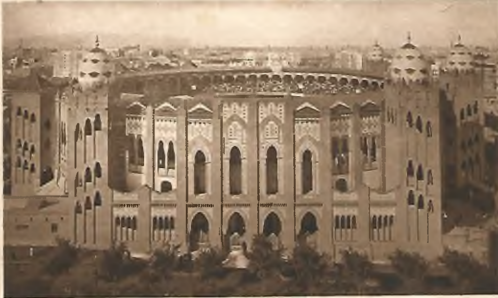
Plaza de Toros Plassa de Braus Place de taureaux Bull fighting Stierkampiplatz

La última plaza de toros de Barcelona se inauguró en 1914 con el nombre de plaza de El Sport. Se amplía y se rebautiza en 1916 con el nombre de Monumental . De estilo neomudéjar y bizantino.