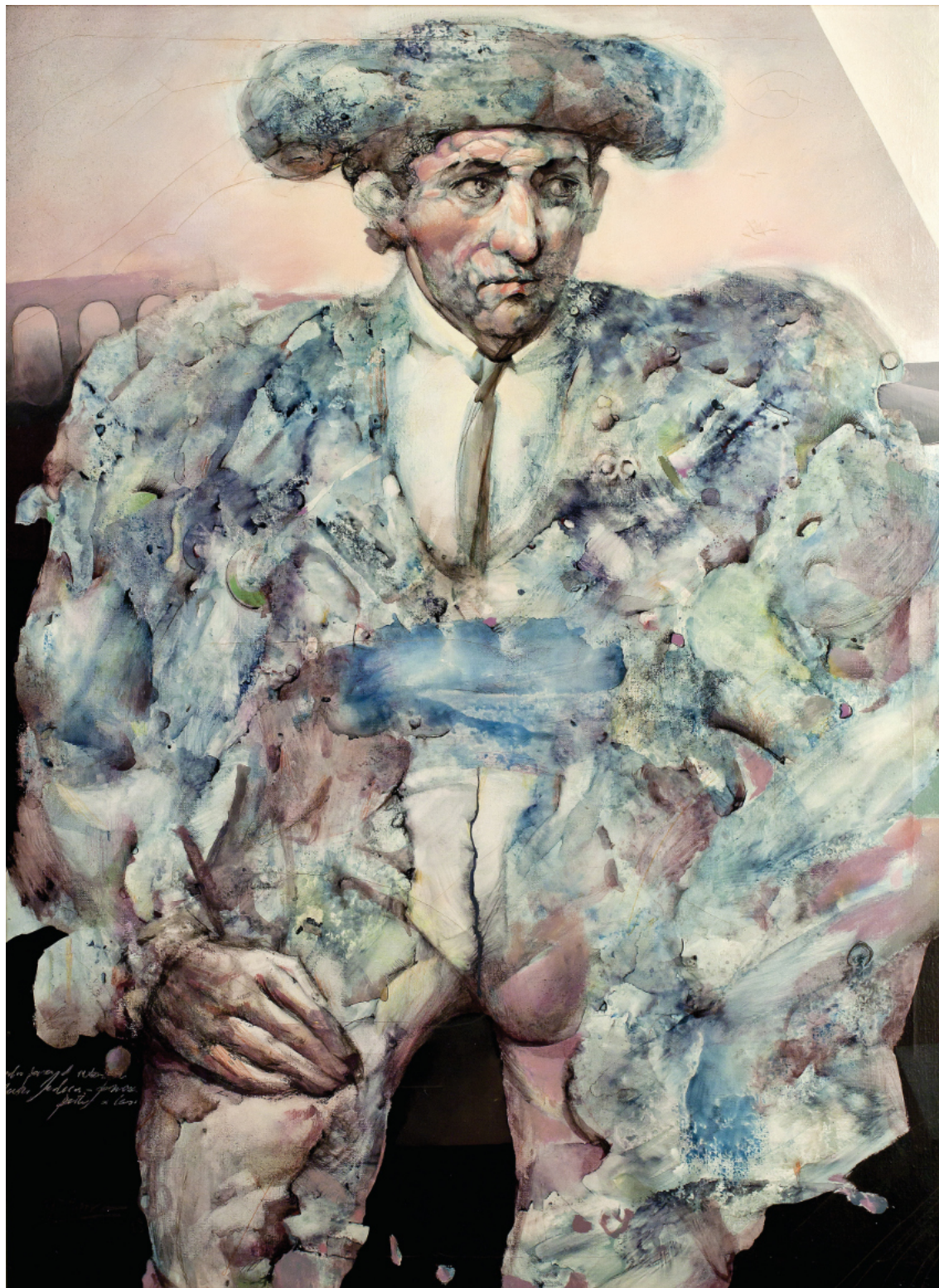
“Traje de luces” ** MANUEL DOMÍNGUEZ GUERRA 100x73 cm. Óleo/lienzo (1983)