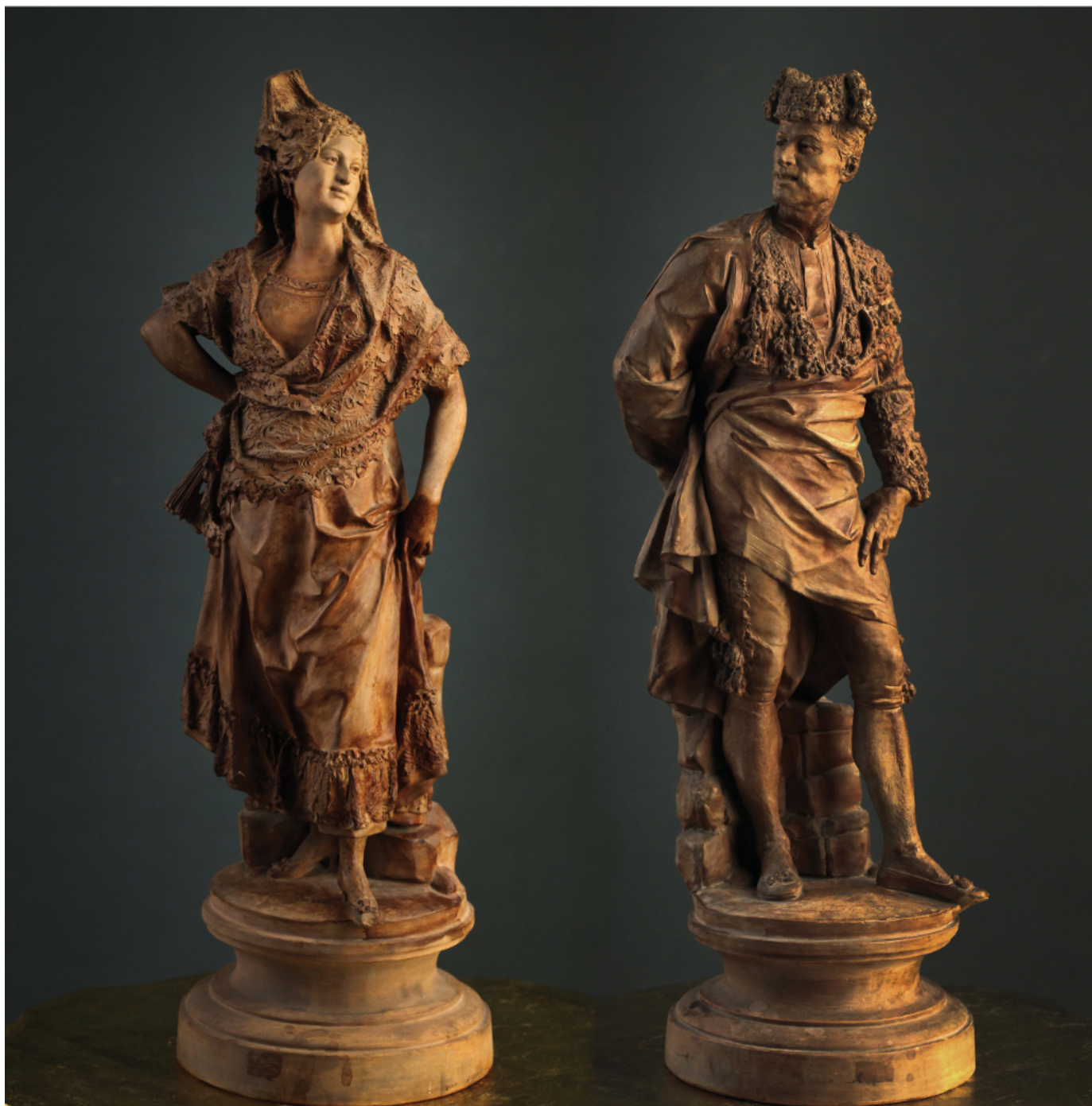
"Manola" "Torero"* AGAPITO VALLMITJANA BARBANY 67x22x22 cm. aprox. para ambas. Terracota