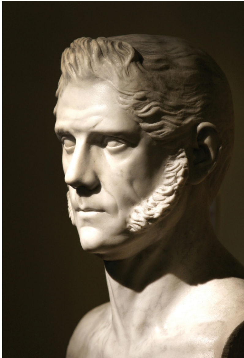
Busto de Francisco Montes "Paquirol" * JOSÉ PIQUER Y DUART 48 x 30 x 20 cms. Mármol (c. 1851)