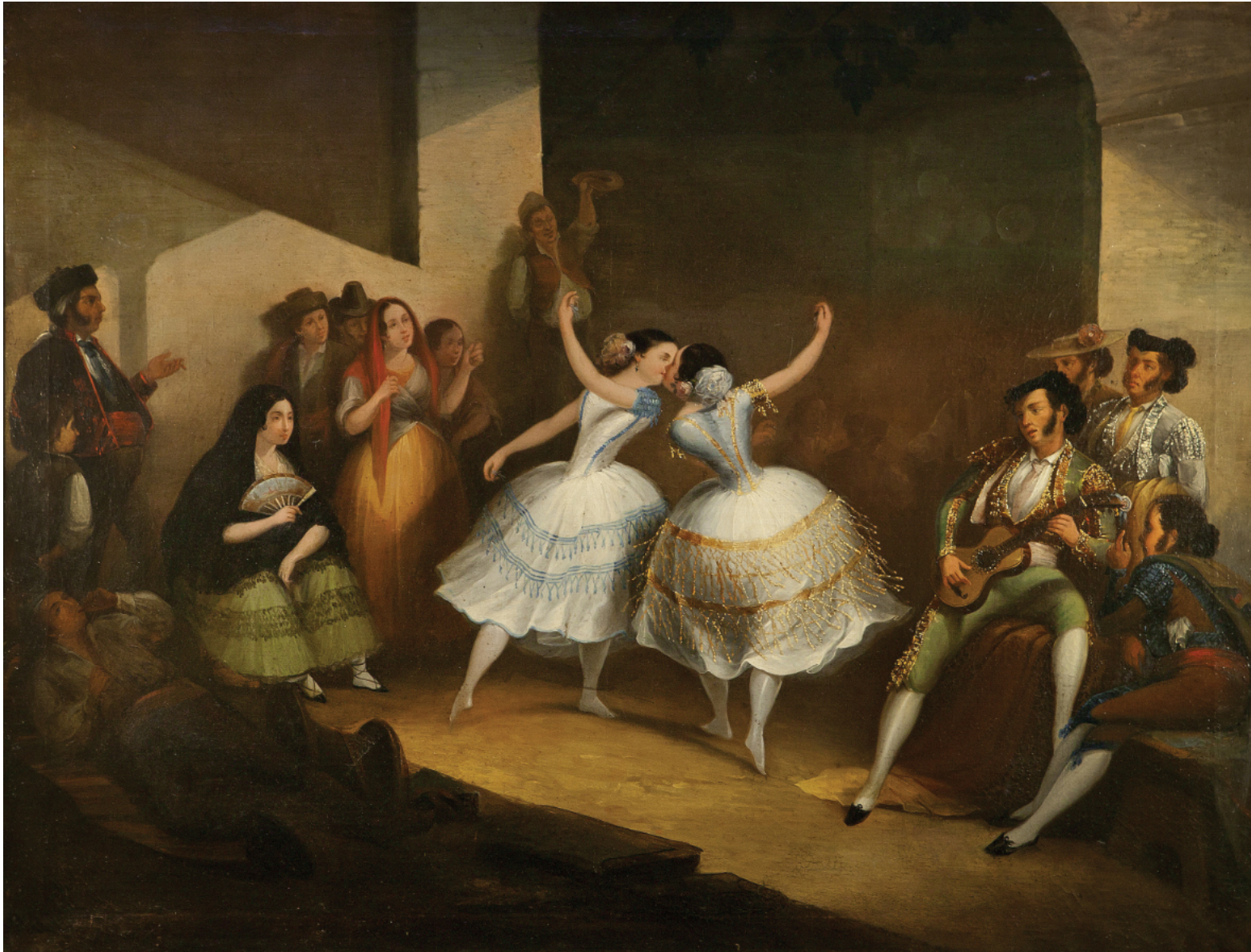
"Jaleo de Cádiz" * ÁNGEL MARÍA CORTELLINI 72 x 95 cm. Óleo/lienzo (c. 1842)