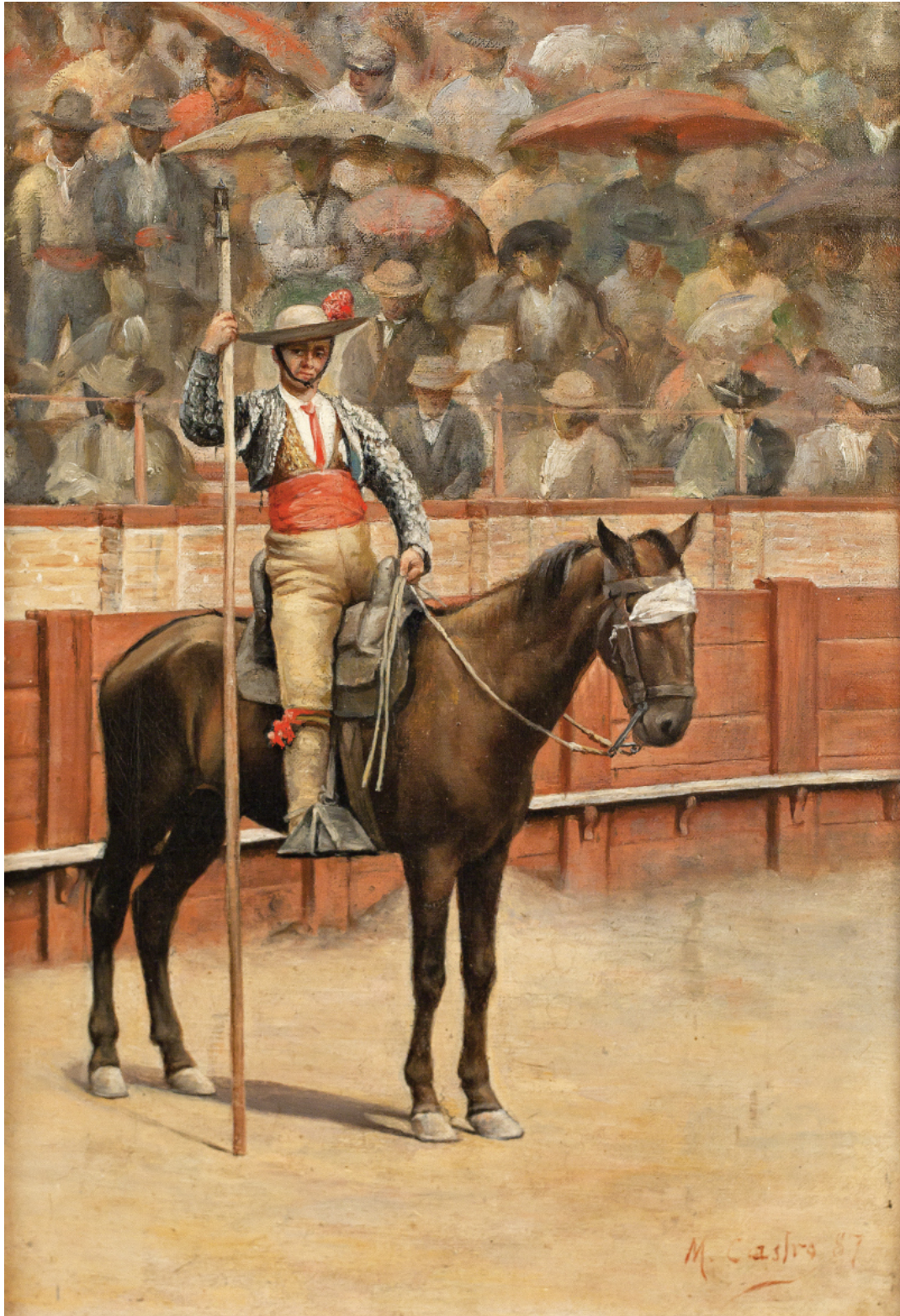
"Picador" * M. CASTRO 26 x 18 cm. Óleo/tabla (1887)