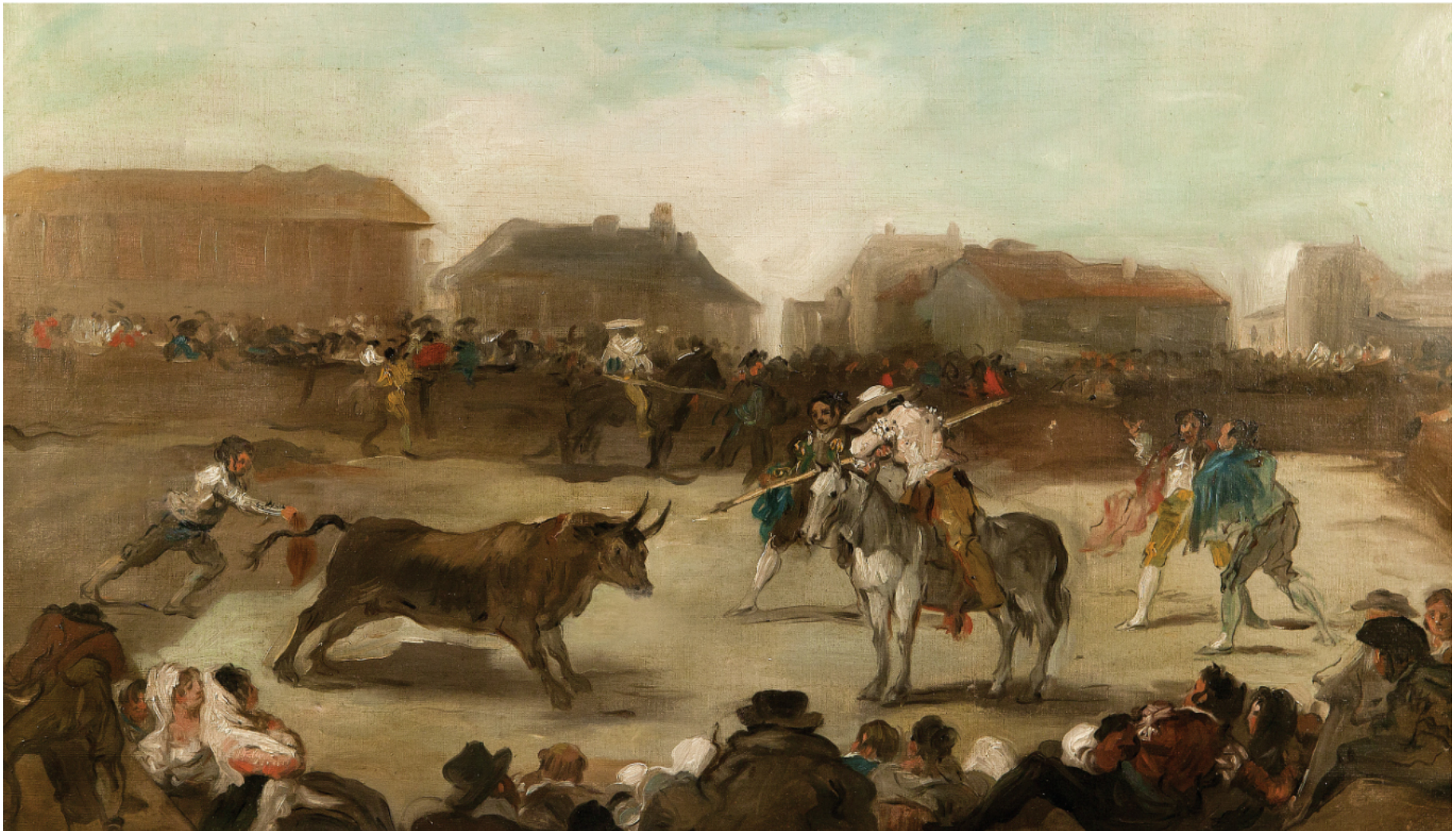
"Corrida en un pueblo" * FRANCISCO LAMEYER 41x72 cm. Óleo/lienzo (c. 1850)