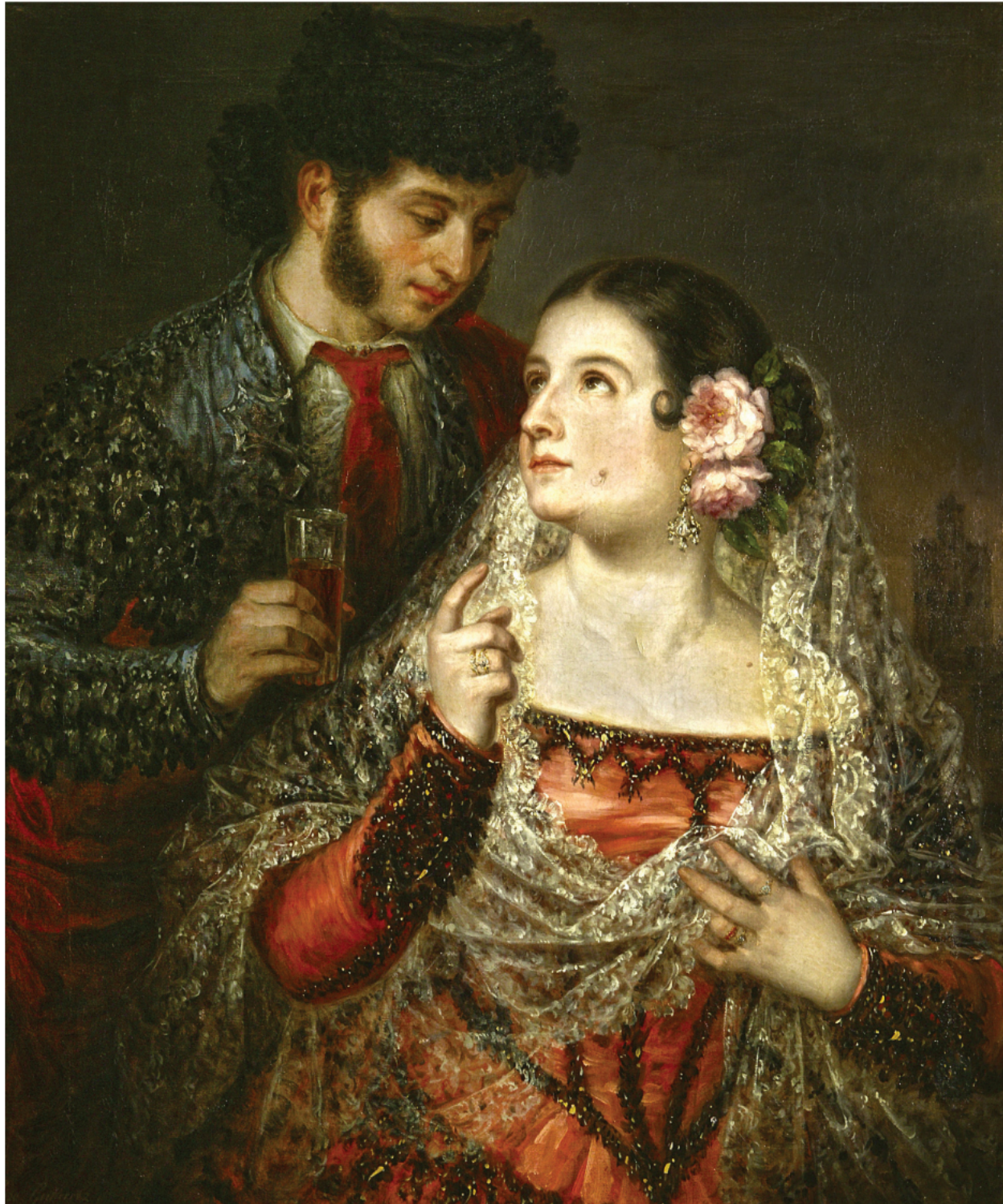
"Paquiro y su esposa" ** JOSÉ GUTIÉRREZ DE LA VEGA 81x70 cm. Óleo/lienzo (1835)