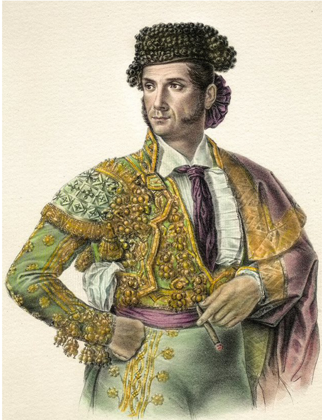
FRANCISCO MONTES. Litografía iluminada. Augusto Belvedere.