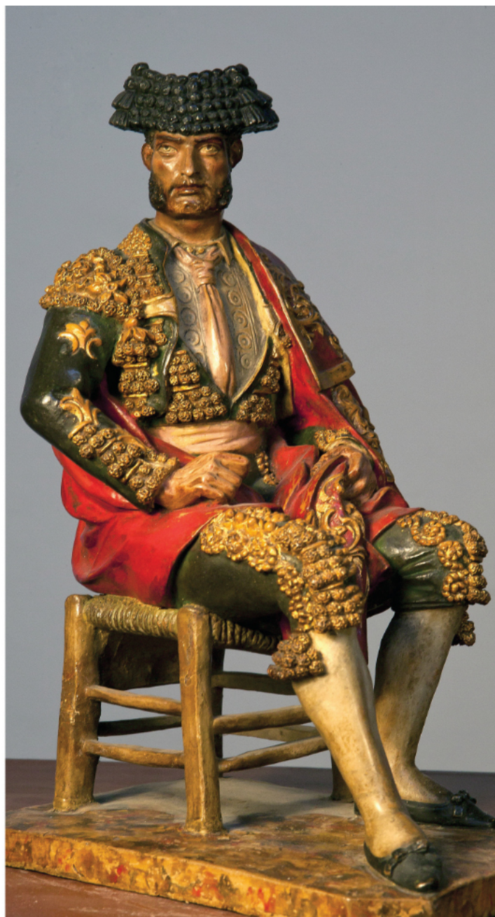
“Paquiro” * ESCUELA DE IMAGINEROS MALAGUEÑA 26x13x18 cm. Barropolicromado