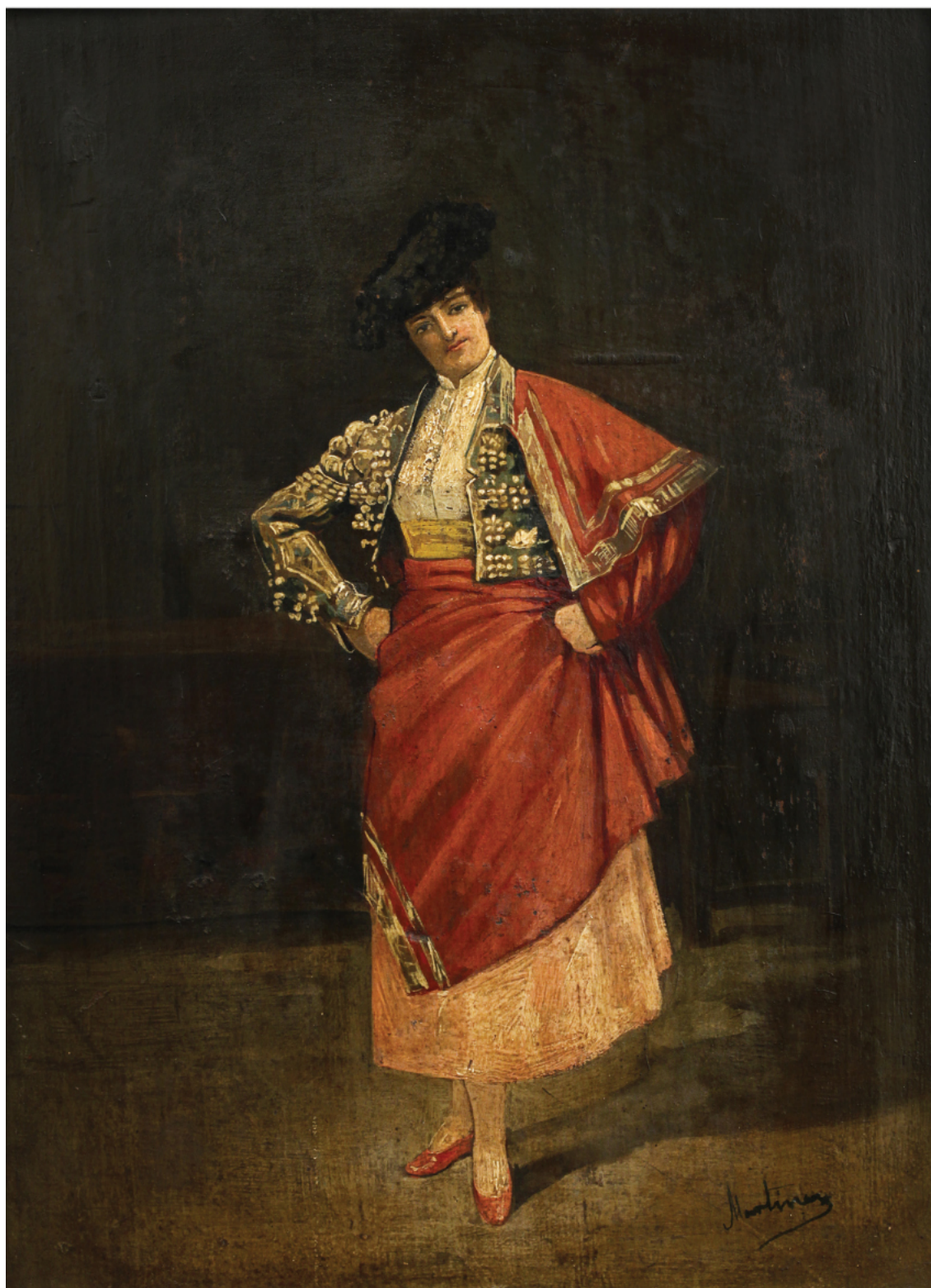
"Señorita torero" * MARTÍNEZ 30 x 22 cm. Óleo/tabla (fines XIX)