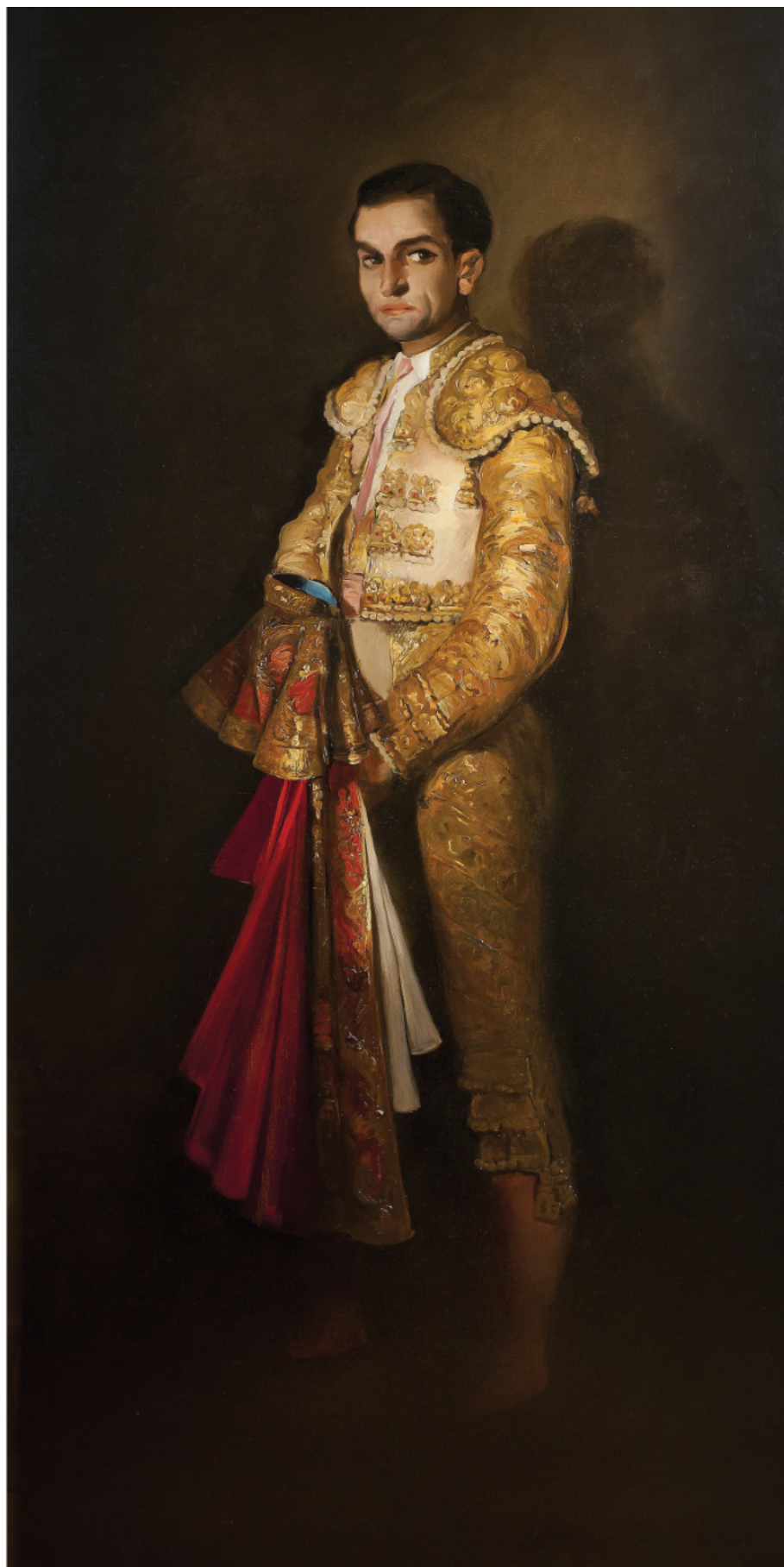
"Juan Belmonte" * VICENTE NAVARRO 198 x 101 cm. Óleo/lienzo (1945)