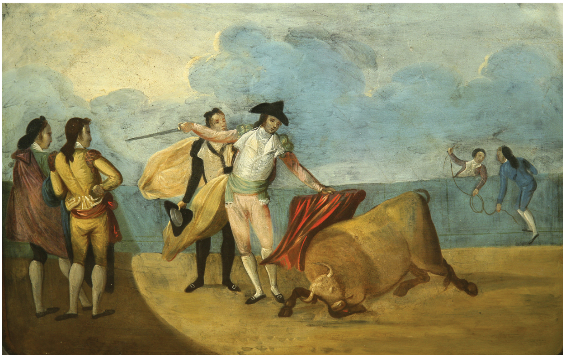
"Pedro Romeroda muerte a un toro" * ANTONIO CARNICERO 56 x 77 cm. Óleo sobre bandeja metálica.