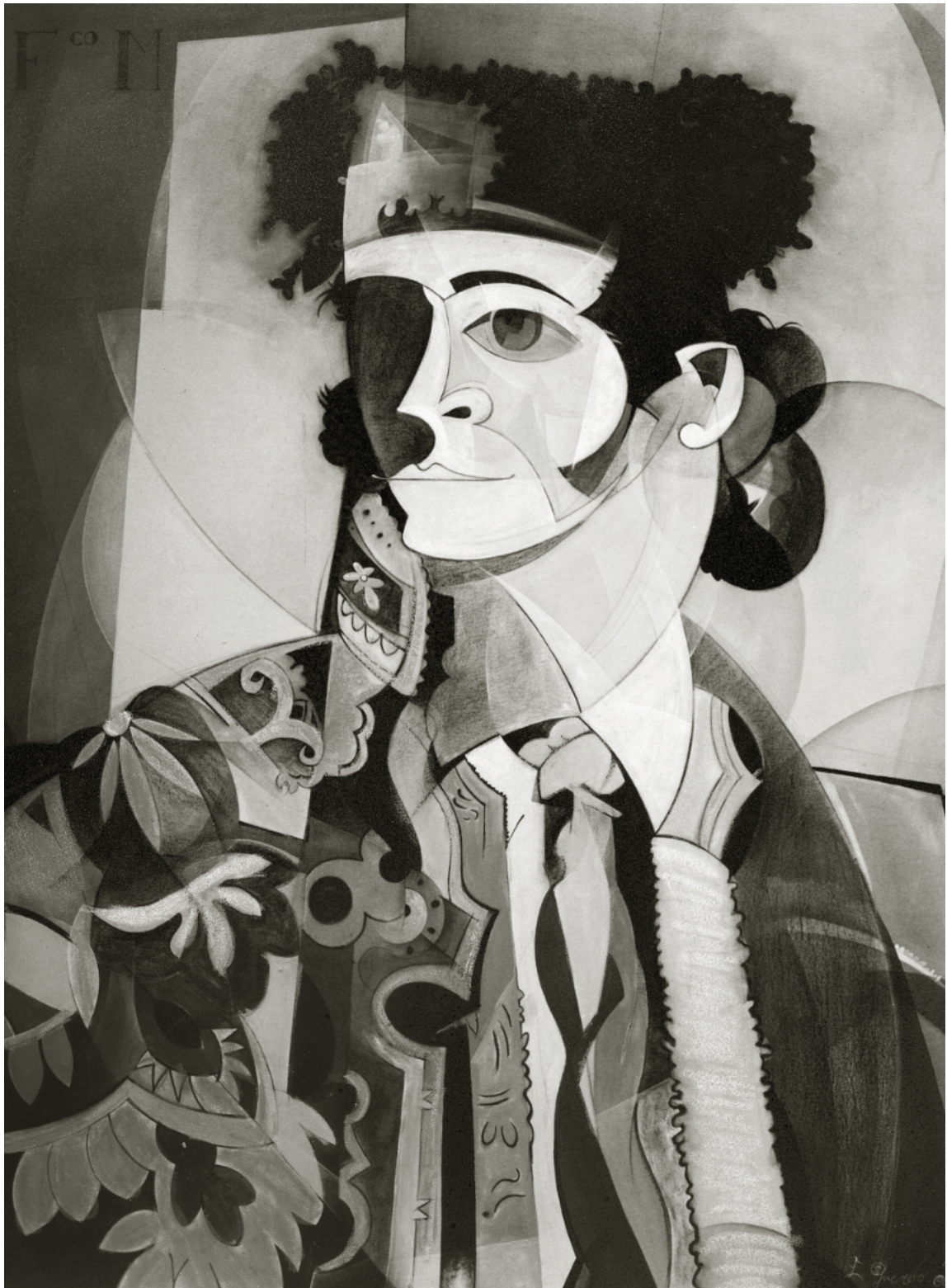
"Paqui"*** ENRIQUE QUEVEDO 145x114 cm. Técnica mixta/lienzo (2000)